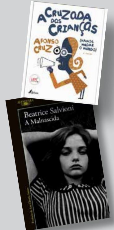
A Cruzada das Crianças AFONSO CRUZ Fábula, 2023

Há muitas histórias dentro da História. De algumas nunca saberemos se são verdadeiras ou inventadas. É o caso da Cruzada das Crianças que terá ocorrido em 1212, formada por uma multidão composta essencialmente por crianças. Afonso Cruz inspirou-se neste episódio do passado para escrever uma história no presente, em que dá voz às reivindicações das crianças por um mundo melhor. Serão ideias ingénuas e utópicas? Talvez. Mas só quem não se deixa derrotar pela realidade pode sonhar com a criação de um mundo mais justo, humano e harmonioso. Uma obra para leitores de várias gerações.