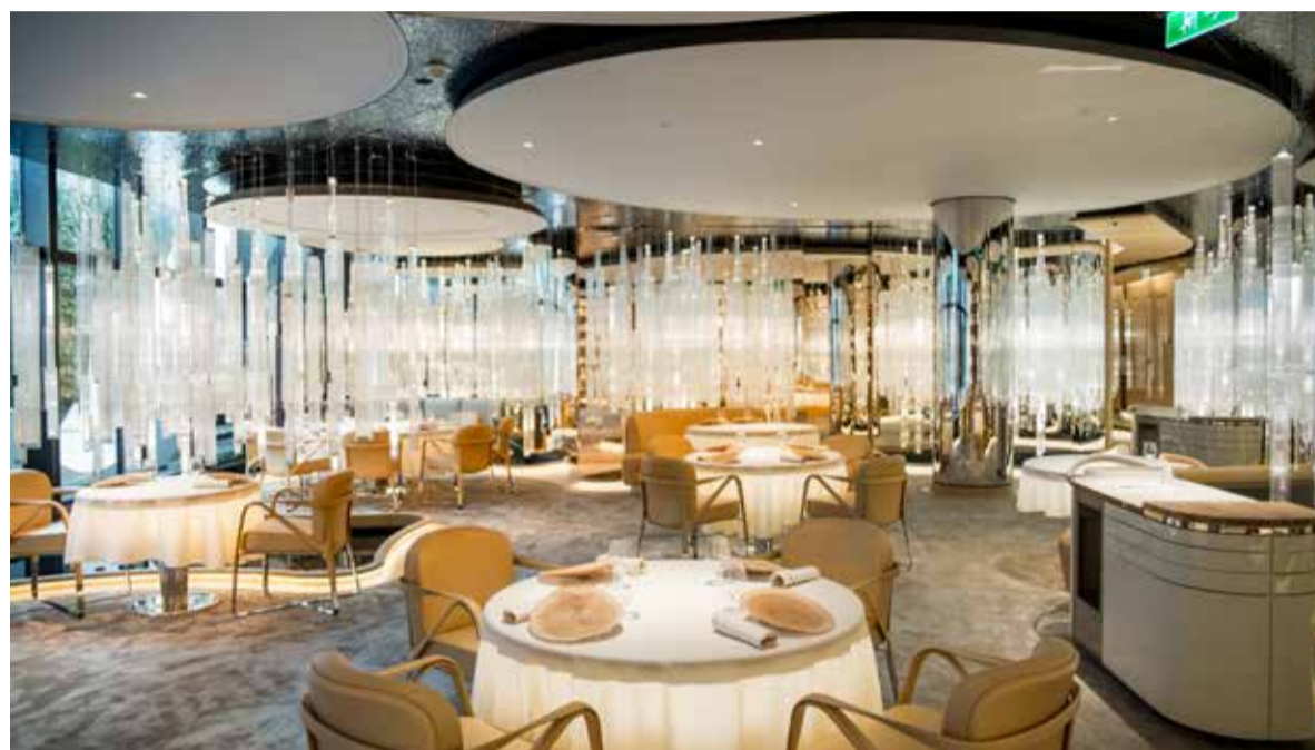
ALAIN DUCASSE AT MORPHEUS