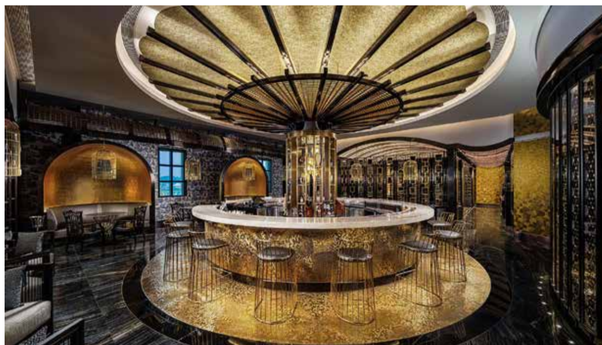
MESA BY JOSÉ AVILLEZ