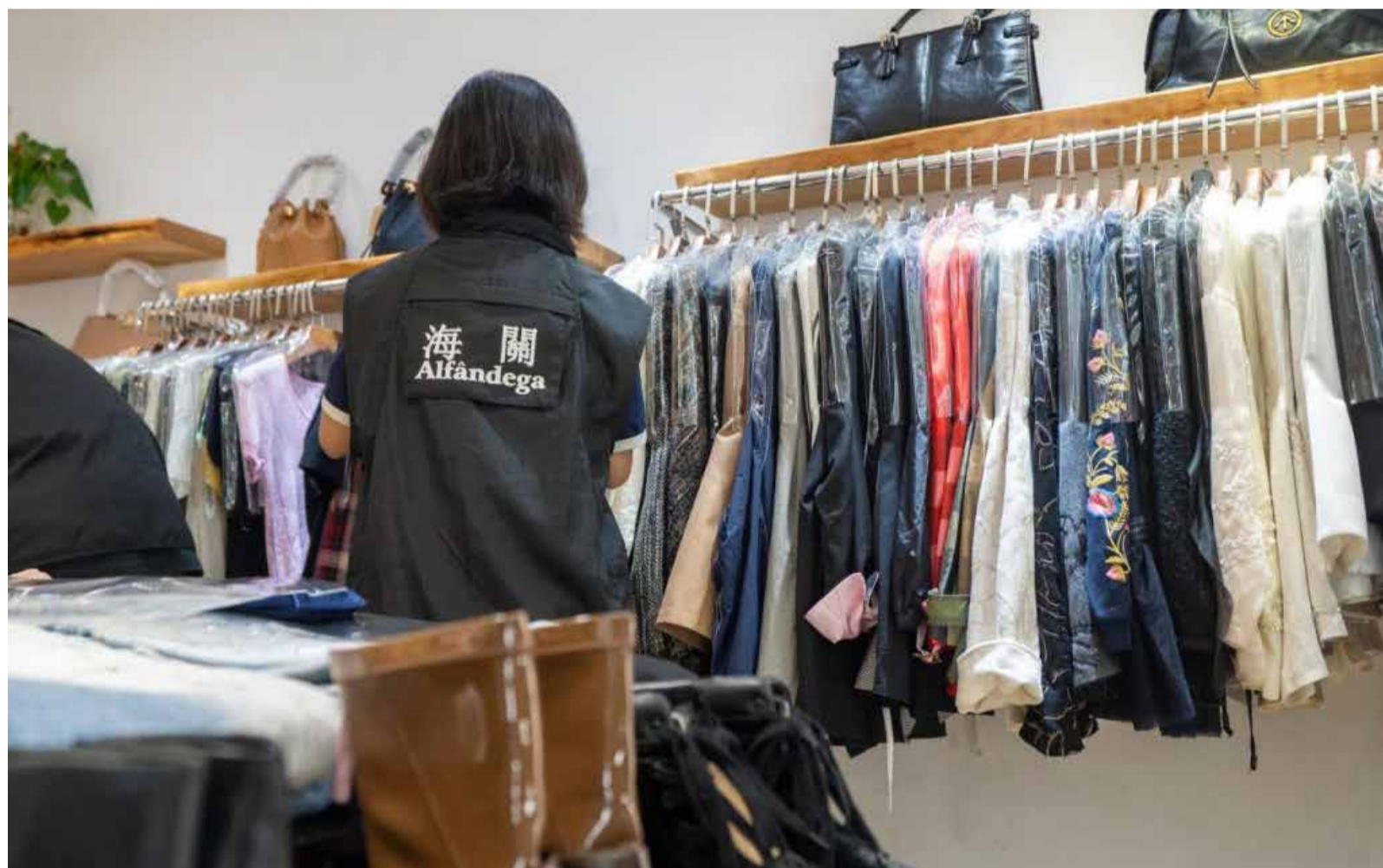
SERVIÇOS DE ALFÂNDEGA

No balanço de trabalhos, a Alfândega assegurou ter reforçado a inspecção e fiscalização às lojas que têm como alvo os clientes tu-