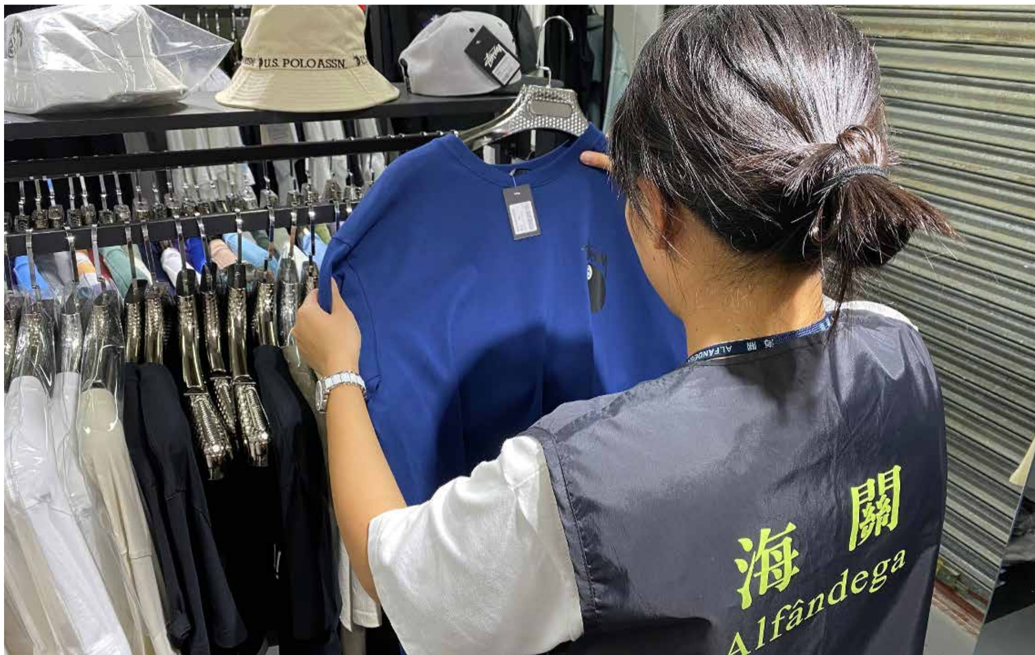
SERVÍCIOS DE ALFÂNDEGA

TERÇA-FEIRA, 28 DE ABRIL DE 2026 ANO XXXII • Nº: 5865 • SÉRIE: III • DIRECTOR: RICARDO PINTO • 10 MOP