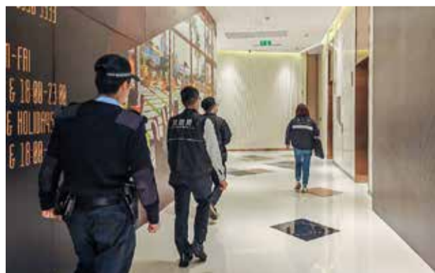
SERVIÇOS DE SAÚDE

As autoridades detectaram, entre Janeiro e Março, 1.524 infracções ao regime de prevenção e controlo do tabagismo. As situações mais comuns foram os casos de fumo ilegal, em que indivíduos fumavam em locais onde não é permitido. Registaram-se 1.459 casos de fumo ilegal, 43 de transporte de cigarros electrónicos na entrada ou saída da RAEM e mais 22 violações de outras disposições, como a falta de afixação de dísticos